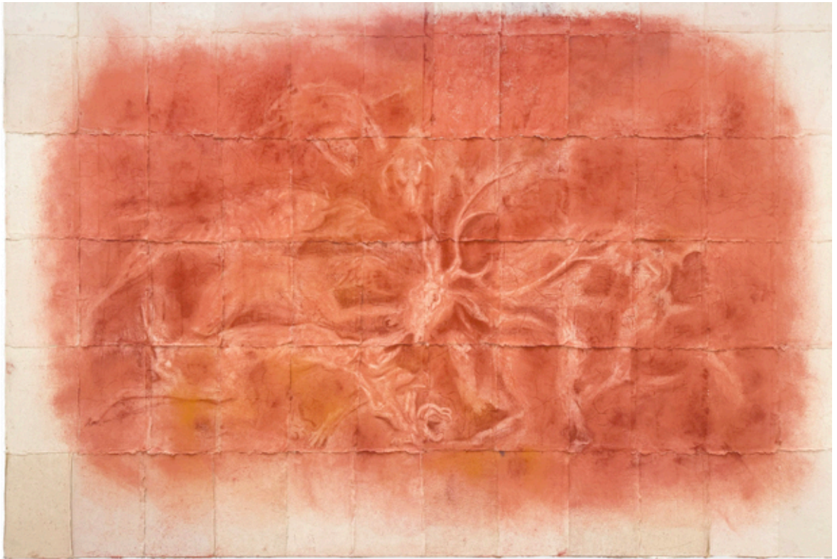
Nasreddine Bennacer, Mnesie , 2026 - Pastel sur papier népalais marouflé sur toile, 200 x 300 cm

Alors que le marché mondial de l'art demeure largement dominé par quelques grands ce (États-Unis, Royaume-Uni et Chine), la scène artistique du Moyen-Orient & de l'Afrique Nord affirme avec force sa singularité et son potentiel.