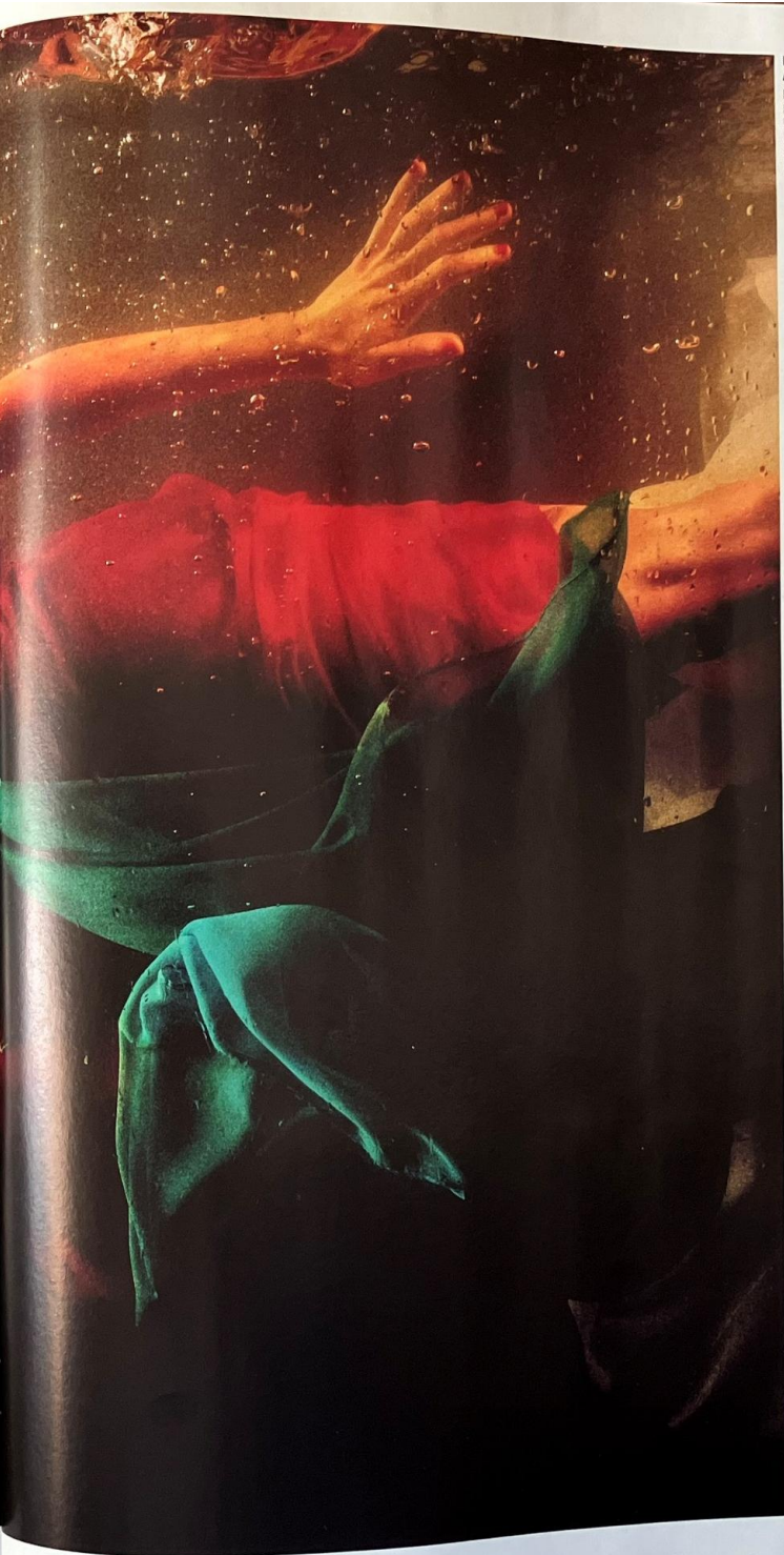
Lara Zankoul, Pearl , 2023, photographie présentée par La Galerie Art District (Beyrouth) lors de l'édition 2025 de Menart Fair.