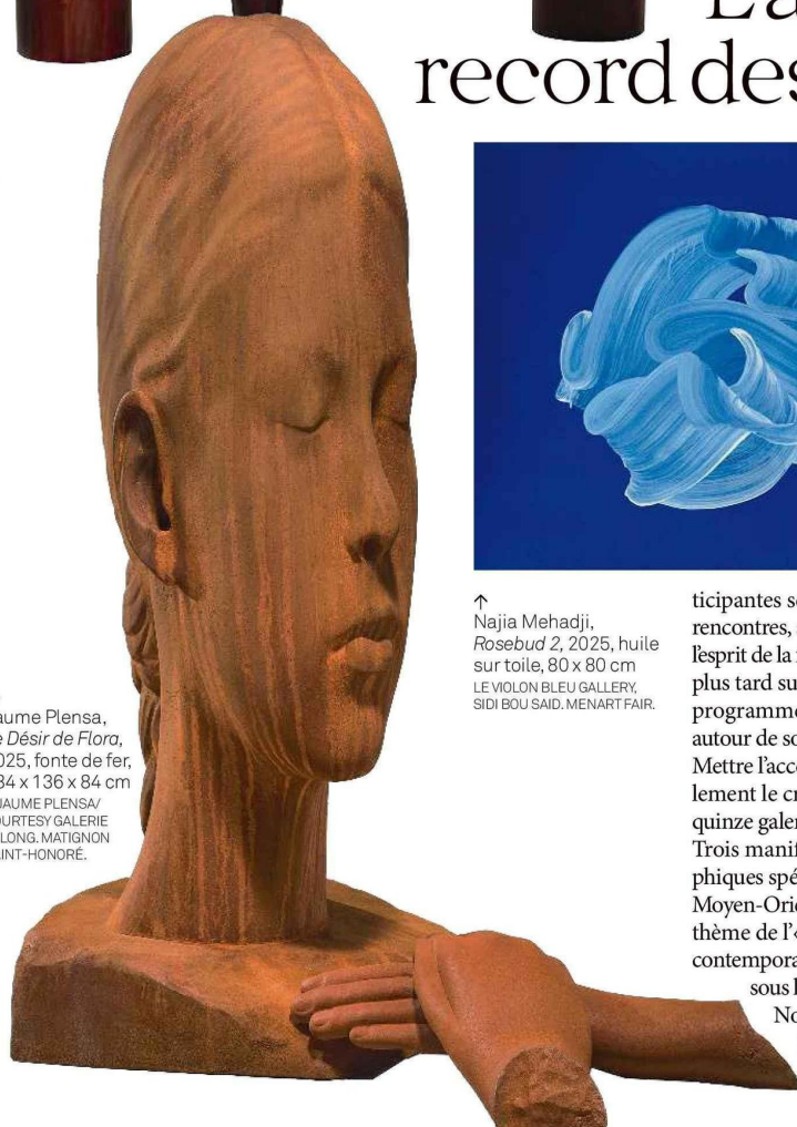
→ Jaume Plensa, Le Désir de Flora, 2025, fonte de fer, 184 x 136 x 84 cm