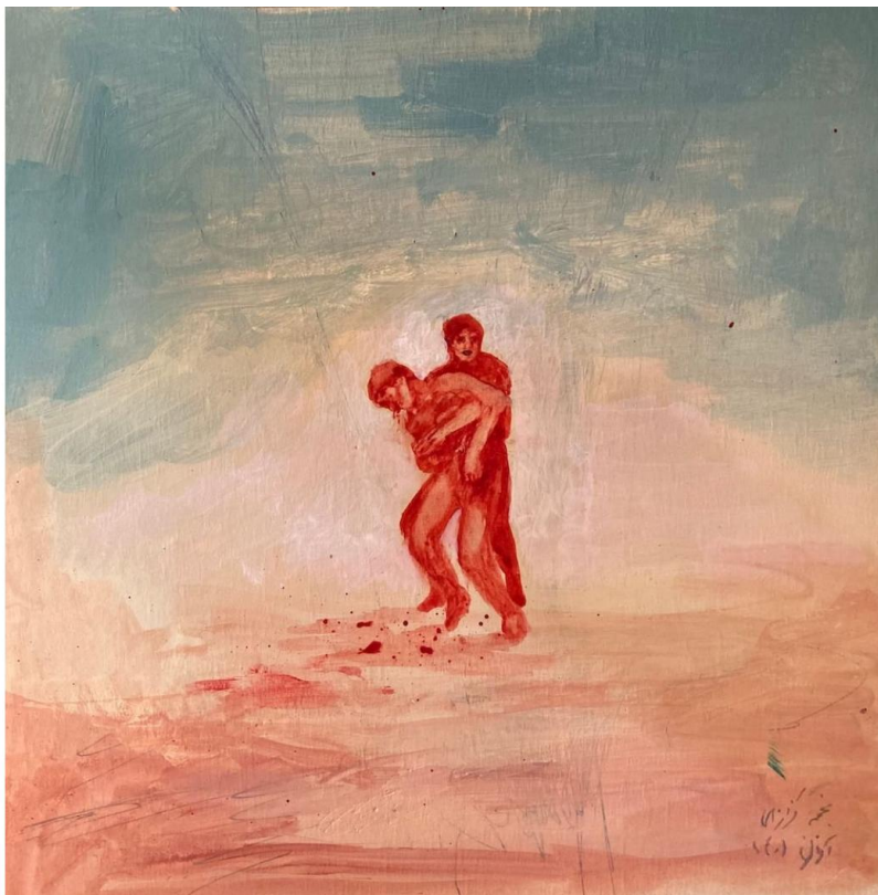
Najme Kazazi, Sans titre, 2022

Menart Fair Galerie Joseph 116, rue de Turenne – 3e Du 25 au 27 octobre 2025 Plus d'infos