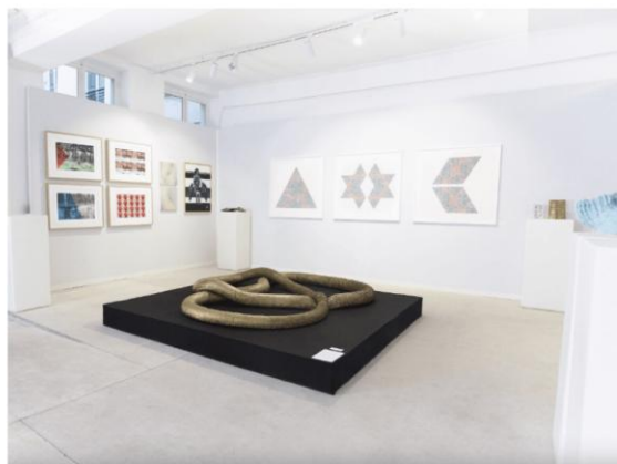
Contemporary art platform, édition 2024