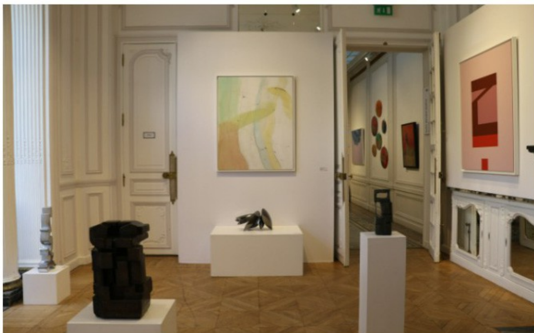
Une vue de l'espace de la galerie libanaise Saleh Barakat.