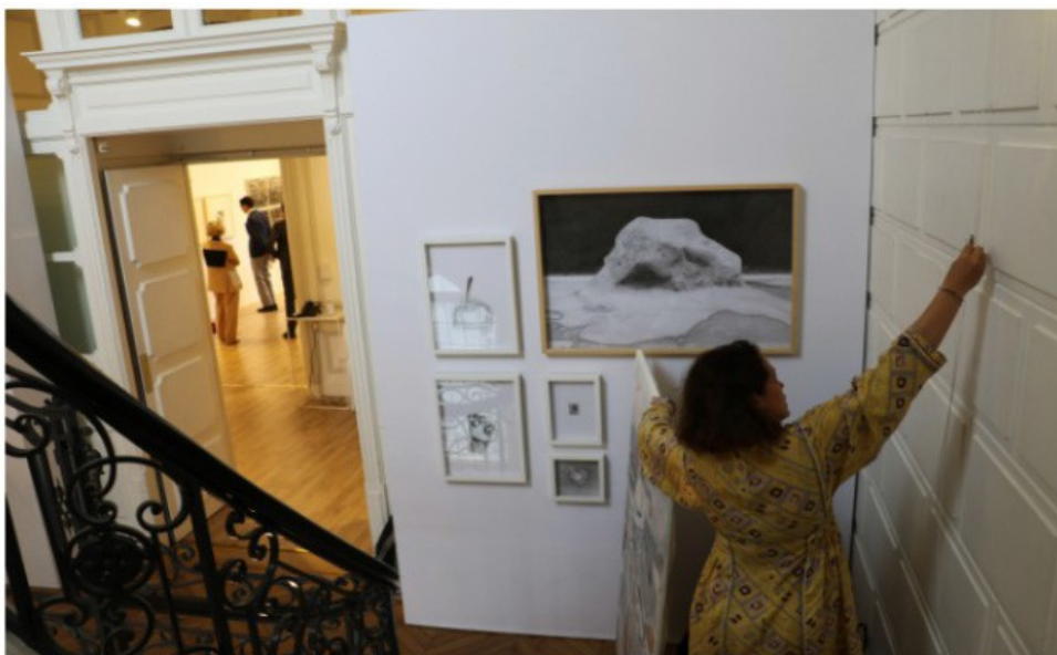
Ce mercredi en fin d'après-midi, à la veille de l'ouverture au public, on accroche les dernières toiles aux murs, on vérifie l'horizontalité des cimaises, on colle les étiquettes sous les œuvres.

PARIS: La Menart Fair reprend ses quartiers dans l'hôtel particulier de la maison Cornette de Saint-Cyr pour une deuxième édition, du 19 au 22 mai. Mercredi en fin d'après-midi, à la veille de l'ouverture au public, on a accroché les dernières toiles aux murs, vérifié l'horizontalité des cimaises, collé les étiquettes sous les œuvres.