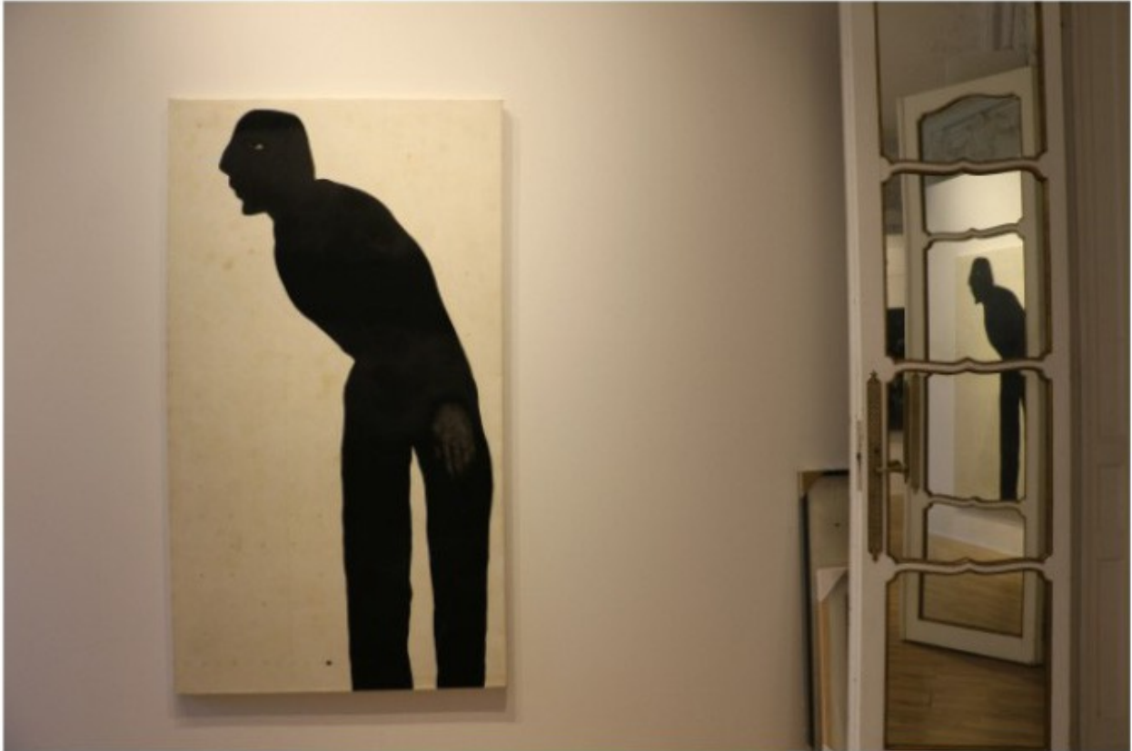
A la Menart Fair.