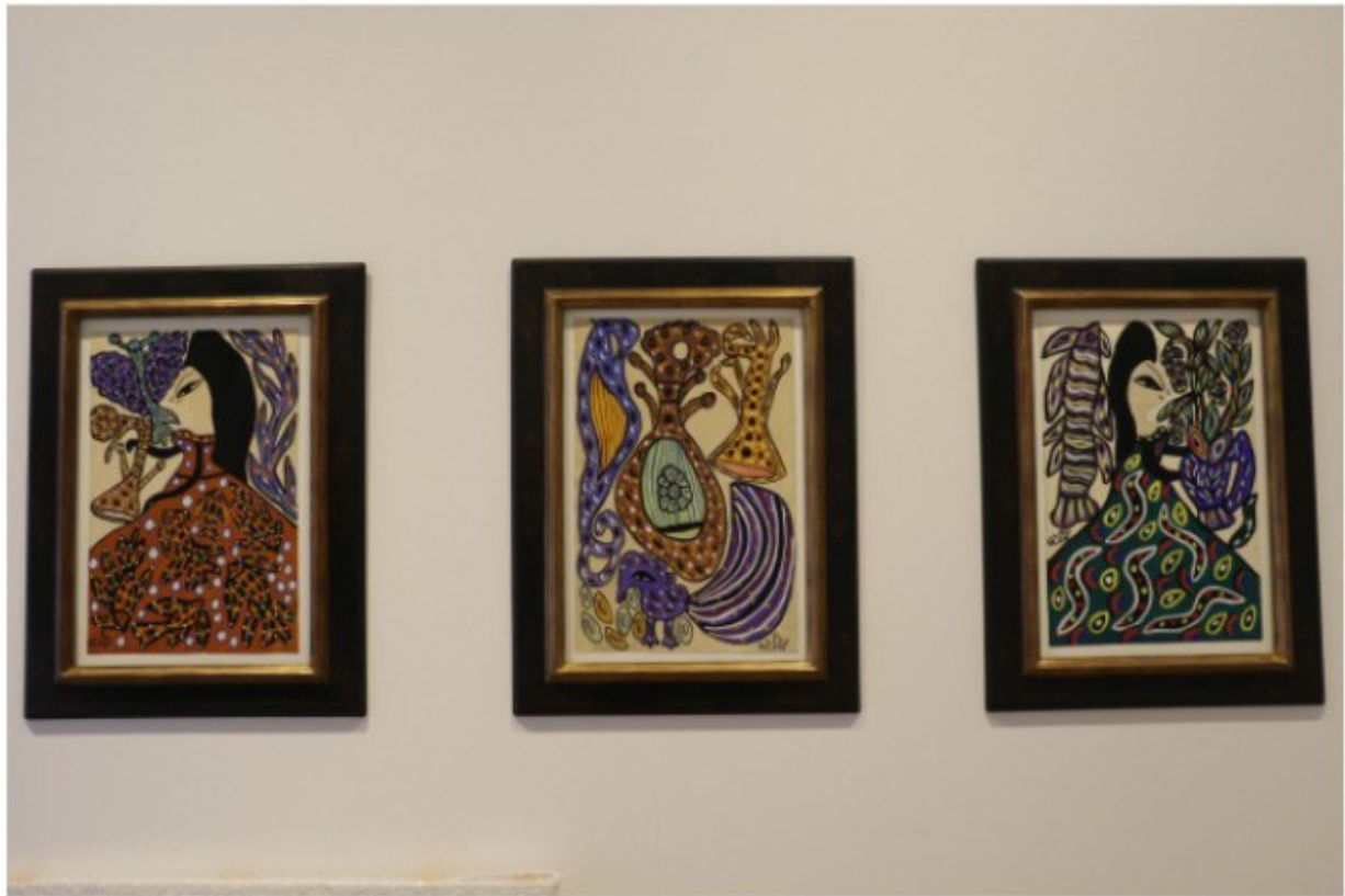
Des oeuvres de Baya.

Menart Fair apporte ainsi un condensé de la scène artistique des pays de la région Mena dans la capitale des arts. «Menart apporte quelque chose d'important en France, car dans l'Hexagone, vous avez des foires dédiées à l'Asie ou à l'Afrique, mais rien sur le Moyen-Orient», remarque-t-elle. «D'ailleurs, quand on parle du Moyen-Orient, généralement, c'est souvent en rapport avec les conflits. Mais le public s'est-il déjà intéressé à la vie artistique de ces pays-là, au foisonnement et aux découvertes incroyables à faire? Il y a de plus en plus d'institutions qui viennent à Menart Fair et qui s'interrogent et regardent de très près l'art de ces régions.»