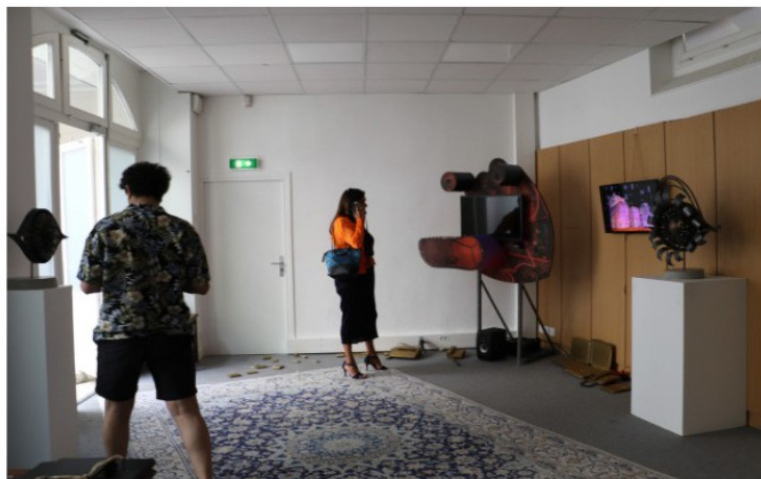
L'espace consacré à l'univers NFT du Mena.