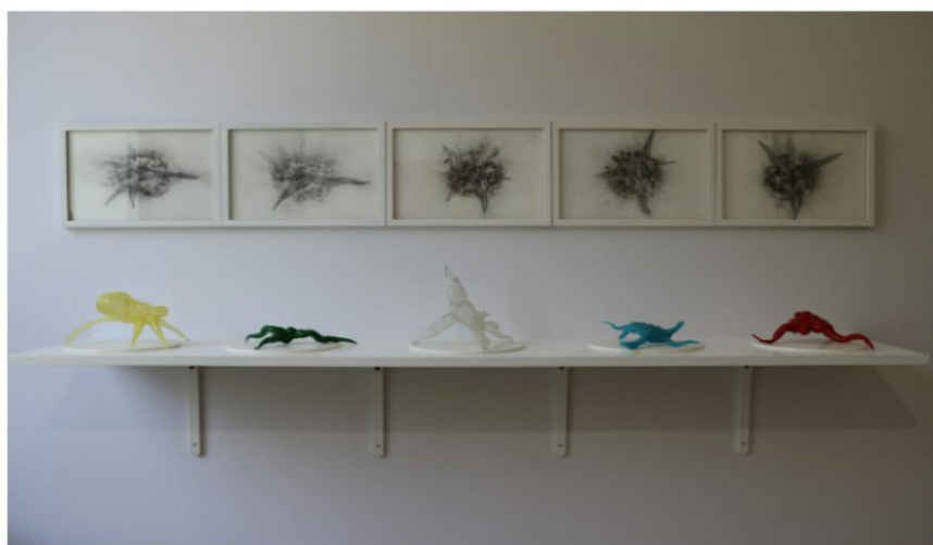
Des oeuvres de l'artiste saoudien Faisal Samra présentées par la galerie 4 Walls.

Menart Fair apporte ainsi un condensé de la scène artistique des pays de la région Mena dans la capitale des arts. «Menart apporte quelque chose d'important en France, car dans l'Hexagone, vous avez des foires dédiées à l'Asie ou à l'Afrique, mais rien sur le Moyen-Orient», remarque-t-elle. «D'ailleurs, quand on parle du Moyen-Orient, généralement, c'est souvent en rapport avec les conflits. Mais le public s'est-il déjà intéressé à la vie artistique de ces pays-là, au foisonnement et aux découvertes incroyables à faire? Il y a de plus en plus d'institutions qui viennent à Menart Fair et qui s'interrogent et regardent de très près l'art de ces régions.»